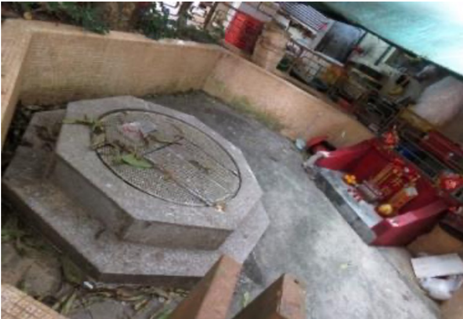
大埔七約風水井與井神神位 至今仍有居民祭祀供奉