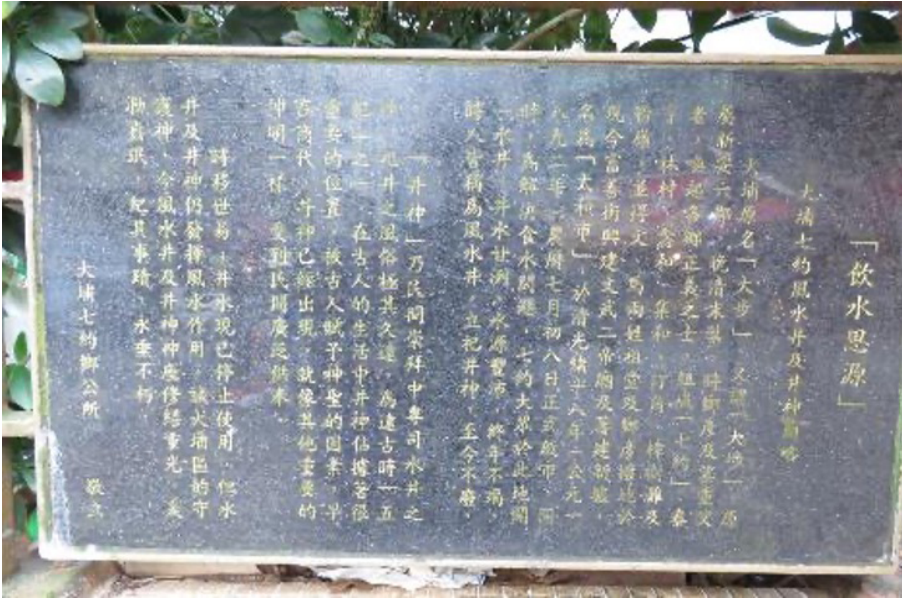
大埔古井周圍建了圍欄，保護這個古跡，圍欄上掛有這個介紹井神的牌匾，上面有介紹說：為解決食水問題，七約大眾在此地開一水井，井水甘冽，水源豐沛，終年不竭，時人皆稱為風水井，立祀井神，至今不廢。